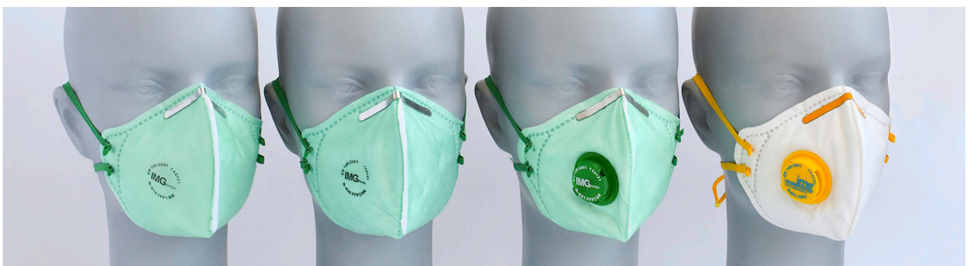
Foto: FFP1, FFP2, FFP2 met ventiel, FFP3 met ventiel.

Afhankelijk van de gewenste efficiency heeft u keuze uit verschillende modellen: FFP1, FFP2 met of zonder ventiel en FFP3 met ventiel. Al onze adembeschermingsmaskers hebben een nauwsluitende pasvorm en zijn voorzien van individueel verstelbare hoofd- en nekbandjes. Hierdoor is de randlekkage nihil en bieden ze optimaal draagcomfort voor nagenoeg alle gezichtsvormen. De specifieke vorm van de adembeschermingsmaskers zorgt bovendien voor een uiterst lage ademweerstand.